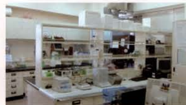
視覺與生理功能實驗室

5. 大四上學期18周實習的安排是本系的重頭戲，系上實習老師會安排學生9周至有開刀房的眼科實習，及9周至具規模及具指導能力的眼鏡行實習，且為嘉惠學生提前進行職場體驗計畫，系上幫學生媒合業界與學生，將9周的實習(眼科或眼鏡行擇一)延伸至8個月，每個月可向業界支薪，且每周需給學生回來修習大四下學期的課程，完成學業，如此不單讓學生畢業即就業，也讓視光業界稍稍疏解人才荒的困境。