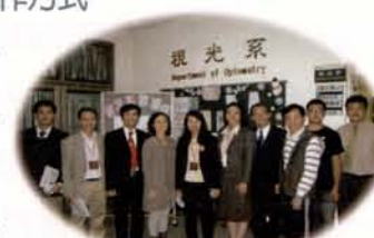
越南海防醫科大學及河內公共衛生學院參訪團蒞校締約暨參訪。

完全替學生尋找提升國際競爭力的管道，配合元培姊妹校的策略聯盟及在校方國際合作處協助下，除了很成功的將學生送出海外實習半年外，目前有越南的海防大學校長、河內公共衛生學院的院長、新加坡眼視光協會、日本純真學園大學、東北文化學園大學正研擬如何進行交換學生實習及學分的認可，而不是純遊學或參訪而已。