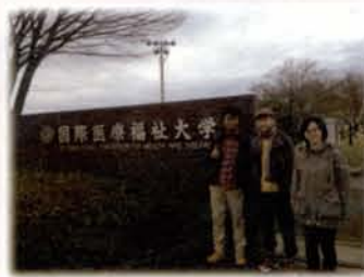
數名學生至日本國際醫療福祉大學交換學生長達半年

5. 大四上學期18周實習的安排是本系的重頭戲，系上實習老師會安排學生9周至有開刀房的眼科實習，及9周至具規模及具指導能力的眼鏡行實習，且為嘉惠學生提前進行職場體驗計畫，系上幫學生媒合業界與學生，將9周的實習(眼科或眼鏡行擇一)延伸至8個月，每個月可向業界支薪，且每周需給學生回來修習大四下學期的課程，完成學業，如此不單讓學生畢業即就業，也讓視光業界稍稍疏解人才荒的困境。