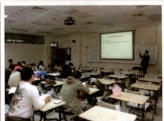
邀請黃華德D.D.演講，主題為「北美眼視光進修管道」