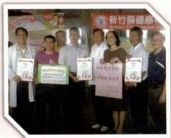
與新竹縣衛生局在北竹的白地里洗惠場，共同舉辦視機能檢測活動。

且配合里長，為低收入戶里民免費配鏡，讓他們也能保有好視力。綜上，二技學生的實習義診加上四技學生eye護社的加入，故元培視光系的義診活動其規模陣容之完整及耗大，可謂是國內視光科、系的先鋒。