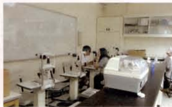
配鏡暨隱形眼鏡實驗室

4. 元培視光系有幾個具特色的實驗室：基礎醫學實驗室、光學物理實驗室、視光綜合實驗室、配鏡暨隱形眼鏡實驗室、視覺與生理功能實驗室及視機能檢測實驗室(視光中心)均提供學生紮紮實實的訓練及情境模擬學習的機會。