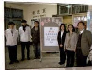
日本純真學園大學參訪

同時這也就是教育部積極推動新一輪的「教學卓越」與「典範科大」計畫的真正精神所在，如何藉由產業界的加入，共同為莘莘學子提供一個「學用合一」的學習環境，與建構進入職場的「第一哩」路，元培視光系雖只創系6至7年，仍有許多亟待克服的困難，以及艱難的要務需予完成。但是只要秉持「以學生及家長為本」的理念，以「教、學、用合一」作為專業人才培育之思維，這才是學生、學校與產業界三贏的最佳機會。