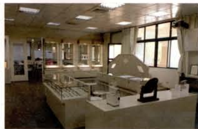
元培科技大學視光系-視光中心

元培視光系之設立係依據96.11.20教育部台技(二)字第0960177038A號核定本校成立光學科技系，且由現今台灣視光科學學會理事長張林松博士當籌備系主任，並於97學年度正式招收四技日間部學生，歸屬於本校「醫護福祉學院」。98學年度正式更名為視光系，99學年度設立視光系二技進修部，以提供一個正式的教育管道，積極培養專業人才及提升北部視光從業人員的能力。到目前為止，四技共8班，376名學生；二技進修部，修業2年，共2班；若是校外學分班者則在校外修習2年後，第3年(相當二技二年級)則回元培校內修習實驗相關課程