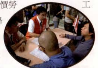
就業博覽會—得恩堂眼鏡設備招募人才

近年來，在高等教育擬定人才培育的方向時，一直被要求亟需與產業接軌之方式進行，否則就會發生如：高等教育所培育的人才與產業界嚴重脫節，且連最基本的產業技術能力均付之闕如。不過平心而論，本來高等教育即在於培育基礎人才之養成教育，對於專業知識的傳授，及技術能力的訓練，應以能進入產業之基本門檻為要件，而非職業訓練所。因此元培視光系均會希望產業界仍不能存有僥倖的心態，不願付出人力訓練的成本，只想坐享其成，甚或接收廉價勞工