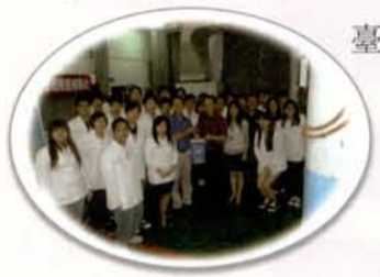
至新竹市世界高中進行視機能檢測活動，檢測對象主要是該校的教職員之團體照。

這六年來，更獲社福團體、獅子會與扶輪社等公益團體邀約不斷，積極希望能與元培視光系建立長期合作關係。