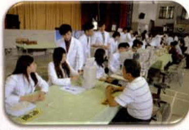
至新竹縣天主教內思高工進行視機能檢測活動

超過3,000人次，受測對象包括國小、國高中師生、社區民眾與偏遠鄉鎮弱勢民眾與老人。除落實「教、學、用合一」教育目標外，也培養學生關懷社會的情懷。元培視光系視機能檢測活動，除屢獲新竹縣邱鏡淳縣長嘉勉外，邱縣長於民國100年邀請本系與新竹縣衛生局、